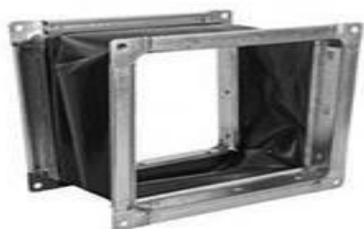
Гибкая вставка прямоугольная DS.