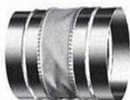
Гибкая вставка круглая SA.